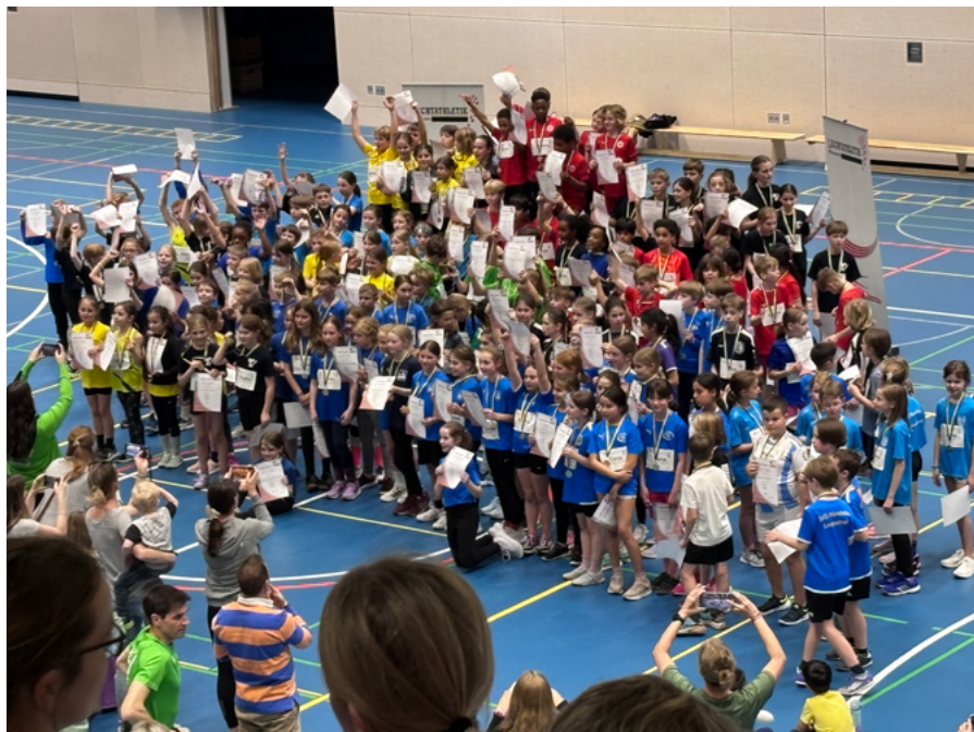
Highlight beim Kila-Teamwettbewerb in Wiesbaden: Die Siegerehrung mit allen Teilnehmern