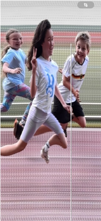
Immer wieder eine Motivation für die vielen Sprints im Training – die anschließende gemeinsame Zielbildauswertung