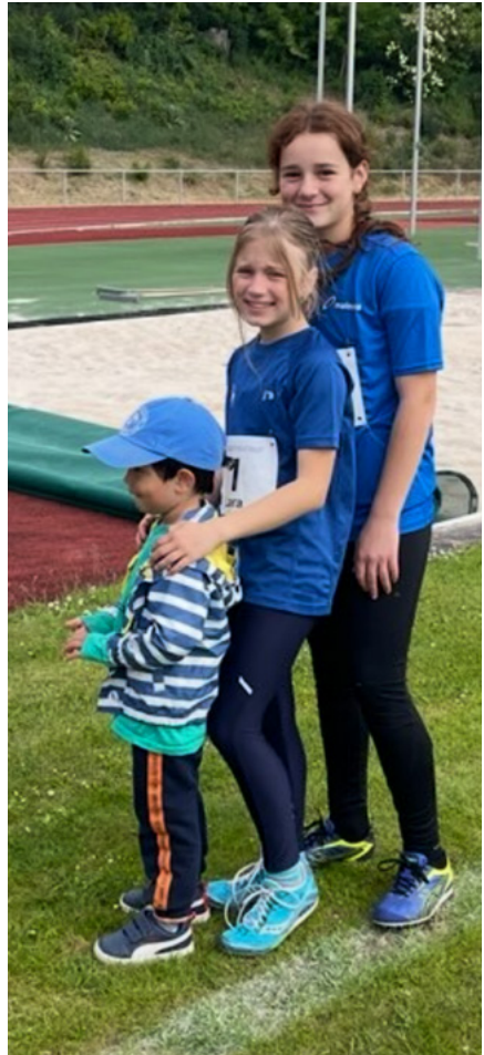
Groß und Klein sind beim Wettkampf mit Freude dabei.