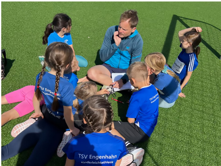
Team-Besprechung zwischen den Disziplinen