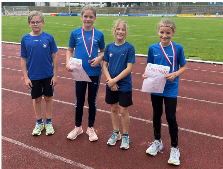
Tolle Platzierungen beim Sommerfest des Turngau Süd-Nassau in Wiesbaden