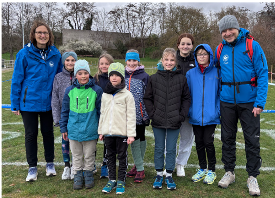
Das Team beim Crosslauf in Geisenheim