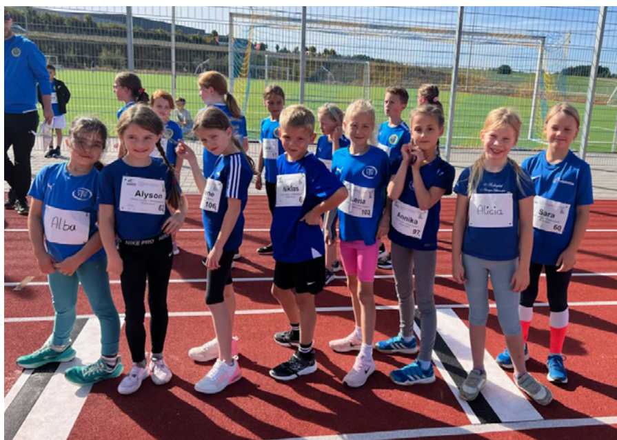
Die U10-Mannschaft mit Kindern vom TV Niederseelbach und TV Waldstraße